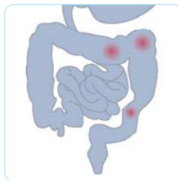
Lokala angrepp (skip lesions)